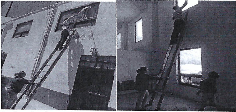
Se limpian los vidrios de las ventanas del área de espera por fuera y por dentro