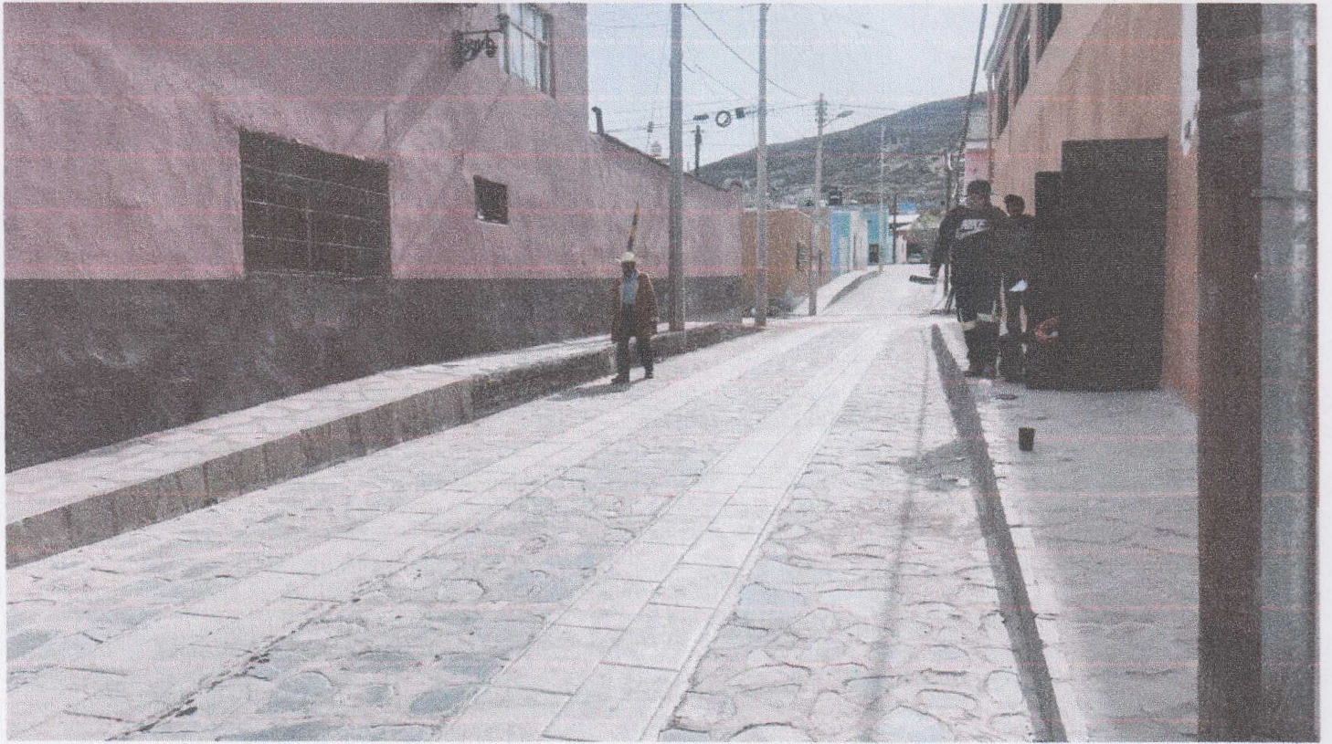
El pavimento de la calle principal de la zona denominada